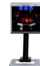
ネックストラップ (46-00868) 標準付属